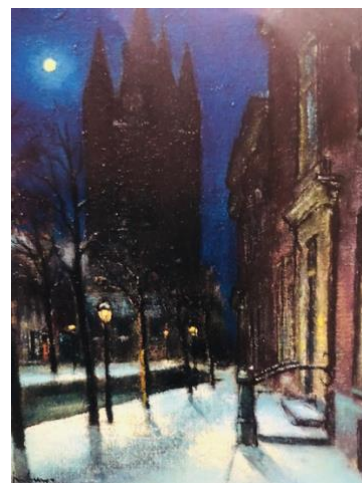
Rechts, gezicht op de Oude Kerk in Delft bij Nacht.